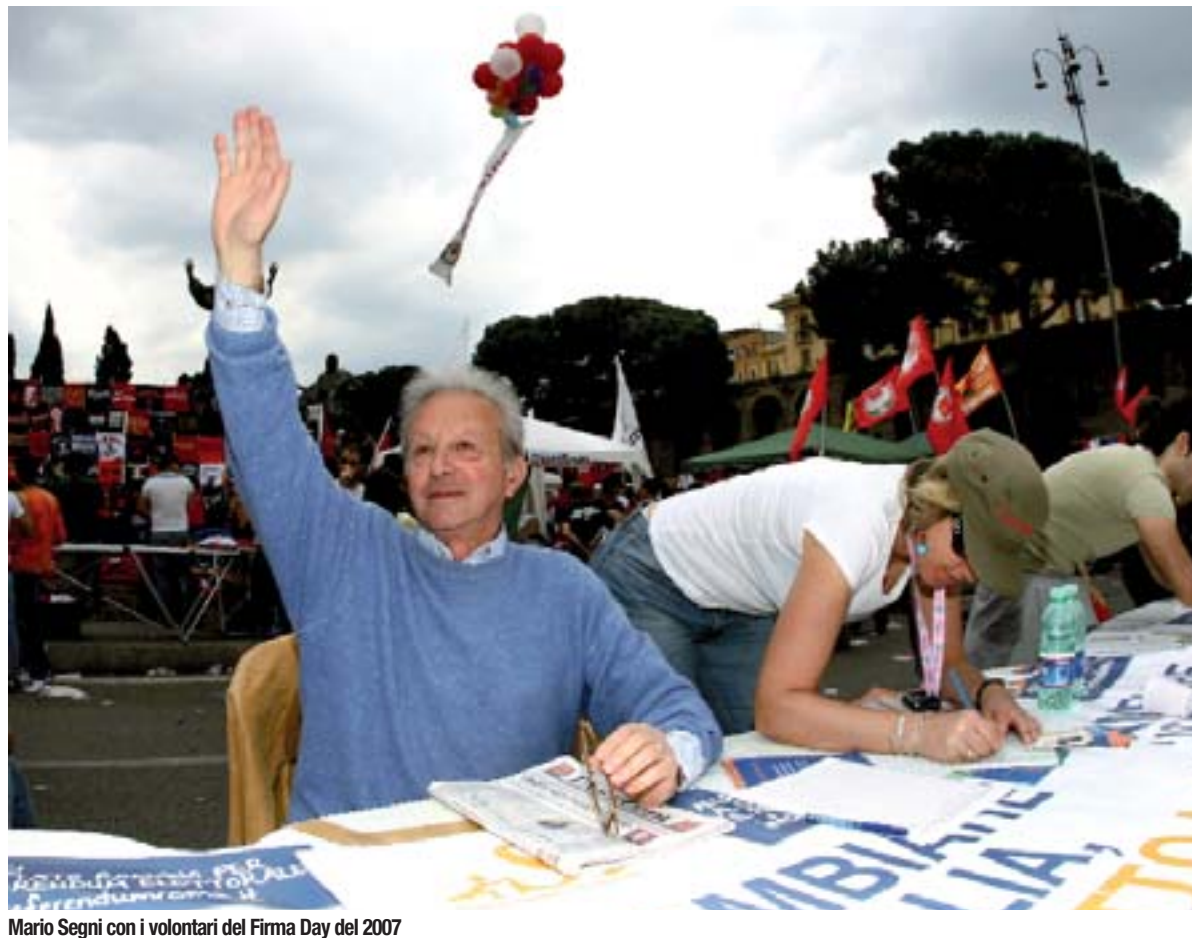
Mario Segni con i volontari del Firma Day del 2007