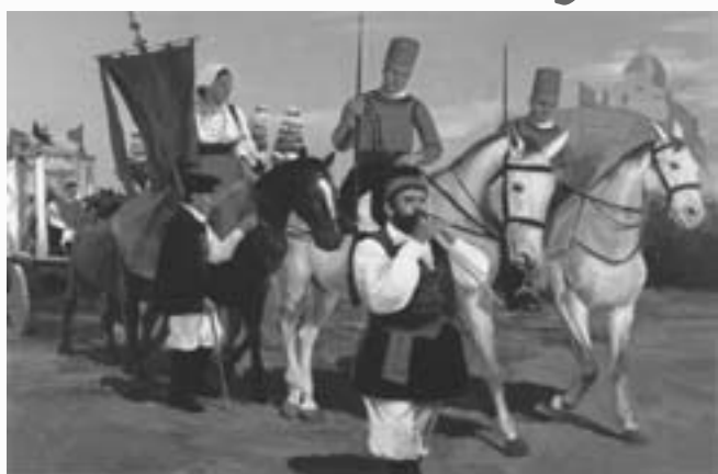
Florjs: Sagra di Sant'Efisio